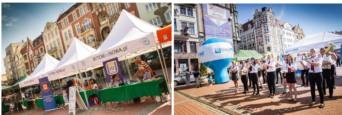
Zdjęcie 3 i 4 – XII Dni Bytomskich Organizacji Pozarządowych. I Międzynarodowe Dni Organizacji Pozarządowych

Relacje z przebiegu imprezy można było śledzić na żywo w telewizji. Festiwalowi Organizacji Pozarządowych przyglądali się reporterzy Telewizji Katowice.