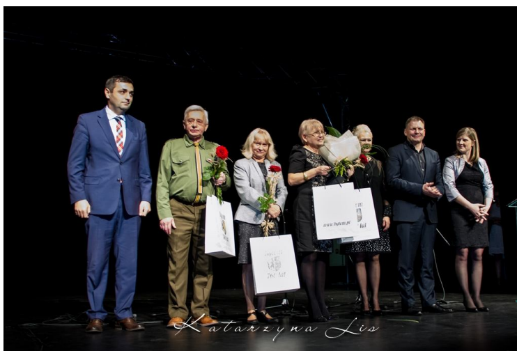
Zdjęcie 5 - „Bytomski Anioł Wolontariatu 2016”