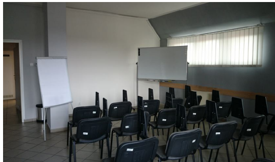
Zdjęcie 2 – sala wykładowa (Rynek 26/5)