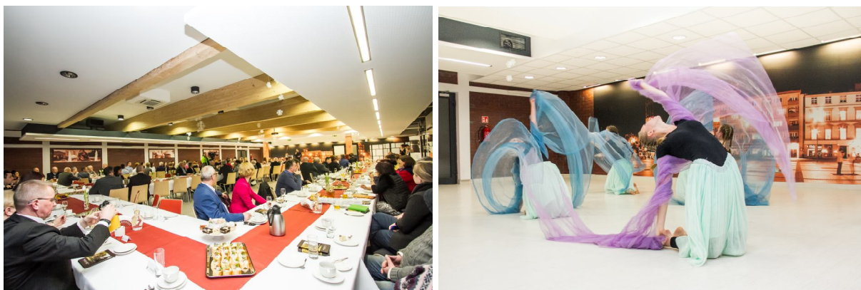
Zdjęcie 6 i 7 – Spotkanie Noworoczne bytomskich NGO.