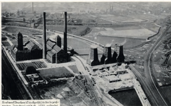
Krautherr/Deuthen (E. Schacht) in der betrieblichen Industrielandchaft, 1930 entstanden.

„Rozbark”, czyli cechownia oraz maszynownia szybu „Bończyk”. Maszynownię wzniesiono już w 1907 roku, a wyróżnia ją ją wysokie, zwieńczone ostrołukiem neogotyckie okna. Z kolei w cechowni, która powstała w 1911 roku, możemy zobaczyć piękny oryginalny wystrój, m.in. płytki z białej glazurowanej cegły; to właśnie w jej wnętrzach Kazimierz Kutz kręcił jedną ze scen filmu „Sól ziemi czarnej”. Obydwa obiekty służą dzisiaj mieszkańcom i zostały zaadaptowane na działalność kulturalną i sportowo-rekreacyjną – w dawnej cechowni KWK „Rozbark” działa Teatr Tańca i Ruchu „Rozbark”, zaś budynek maszynowni „Bończyk” jest dziś częścią Centrum Sportów Wspinaczkowych i Siłowych, a mieści się w nim siłownia.