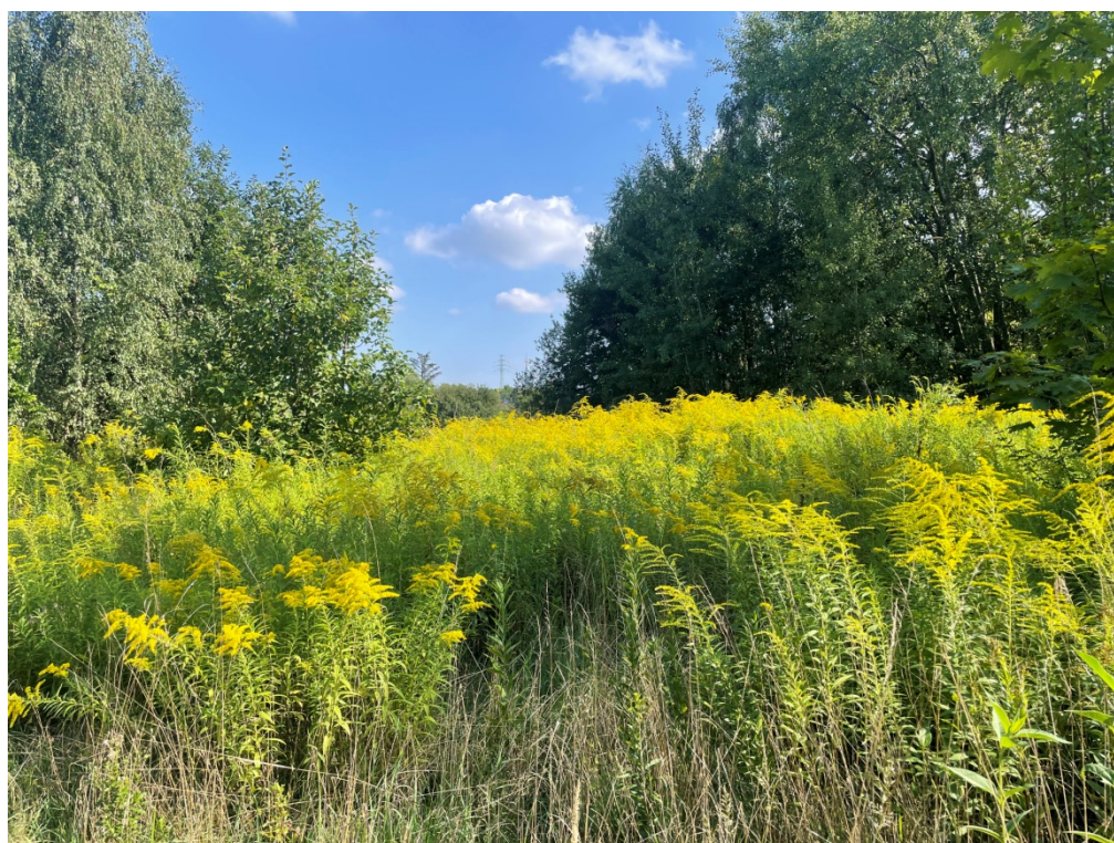
ZDJĘCIE 6 Monocenozy nawłoci ( Solidago sp.), w rejonie nieużytków w północnej części terenu