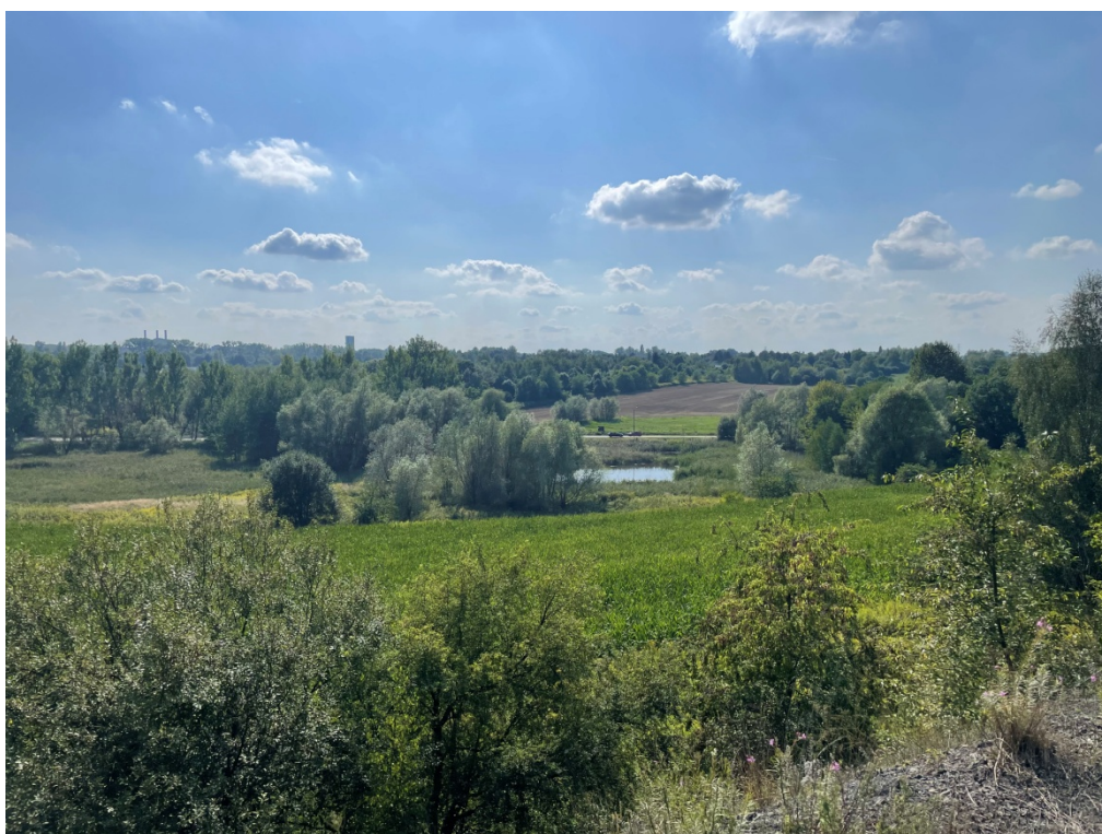
ZDJĘCIE 7 Obszary użytków rolnych, zadrzewienia oraz zbiornik wodny, w północnej części terenu