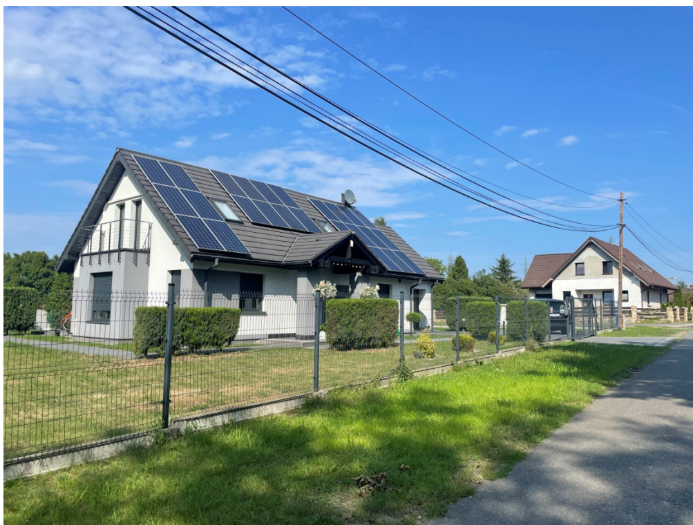
ZDJĘCIE 2 Zabudowa mieszkaniowa jednorodzinna, w rejonie ul. Północnej