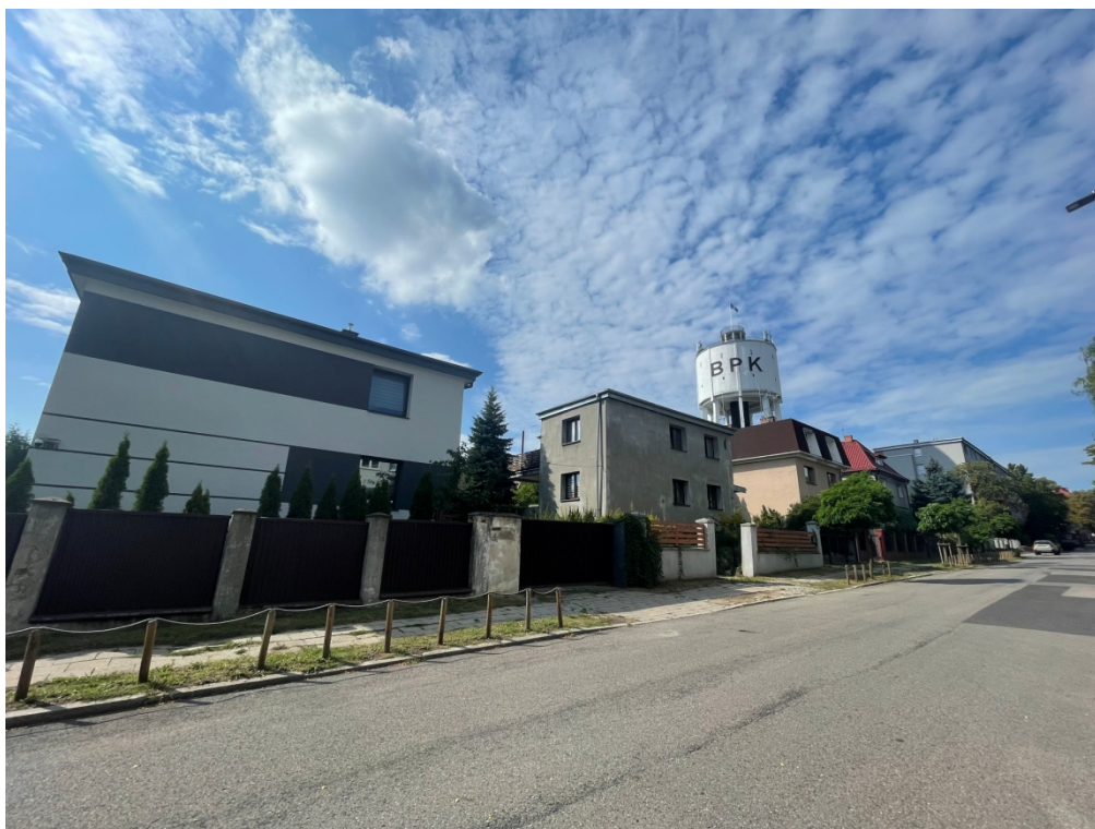
ZDJĘCIE 1 Zabudowa mieszkaniowa przy ul. Oświęcimskiej oraz wieża wodna – obiekt zabytkowy