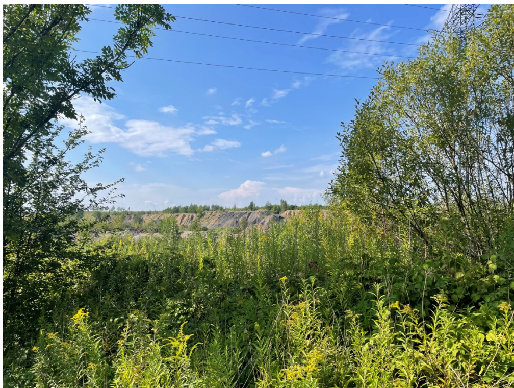
ZDJĘCIE 8 Grunty nasypowe oraz płaty roślinności spontanicznej, w rejonie obszaru pogórniczego nr 132