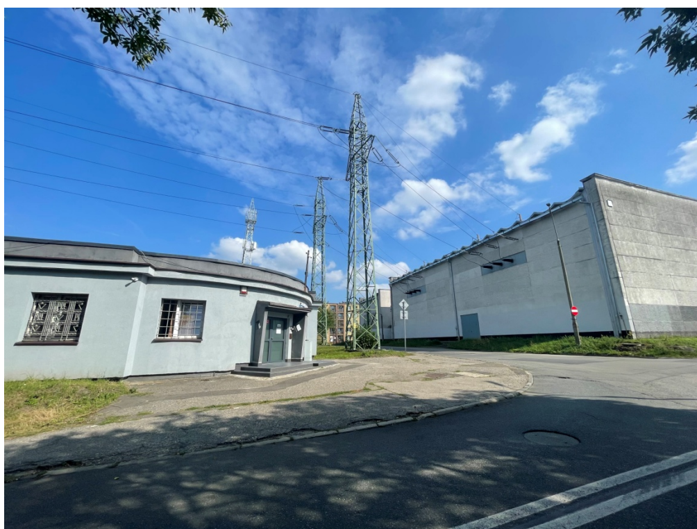
ZDJĘCIE 4 Stacja elektroenergetyczna Bolko 110 kV, ul. Mickiewicza