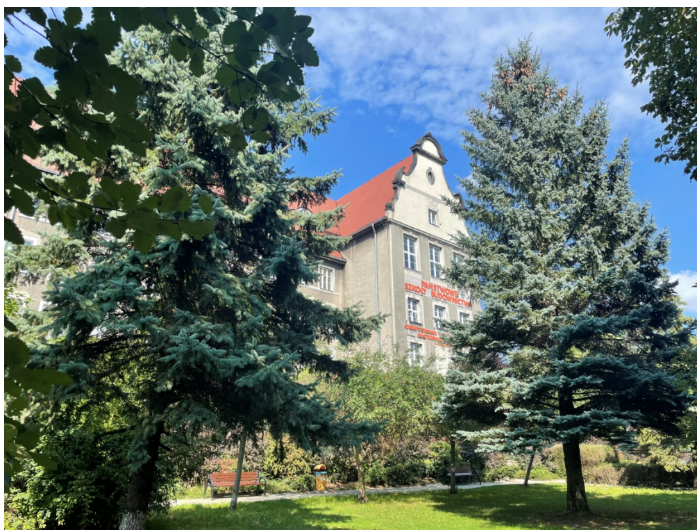
ZDJĘCIE 3 Budynek Państwowych Szkół Budownictwa wraz z zielenią urządzoną, ul. Powstańców Śląskich