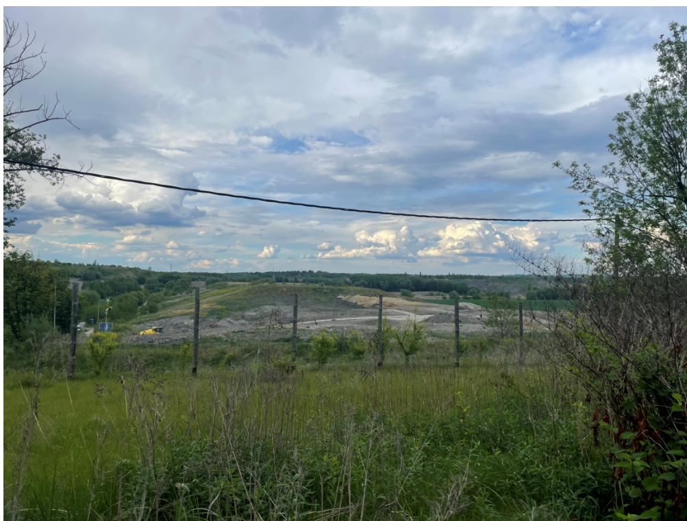
ZDJĘCIE 2 Teren składowiska odpadów – widok od ul. Brzezińskiej