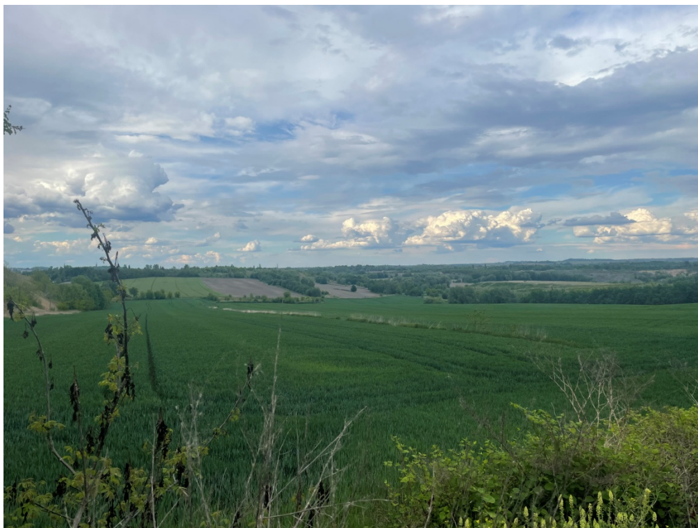
ZDJĘCIE 5 Powierzchnie upraw zbożowych, w północnej części terenu