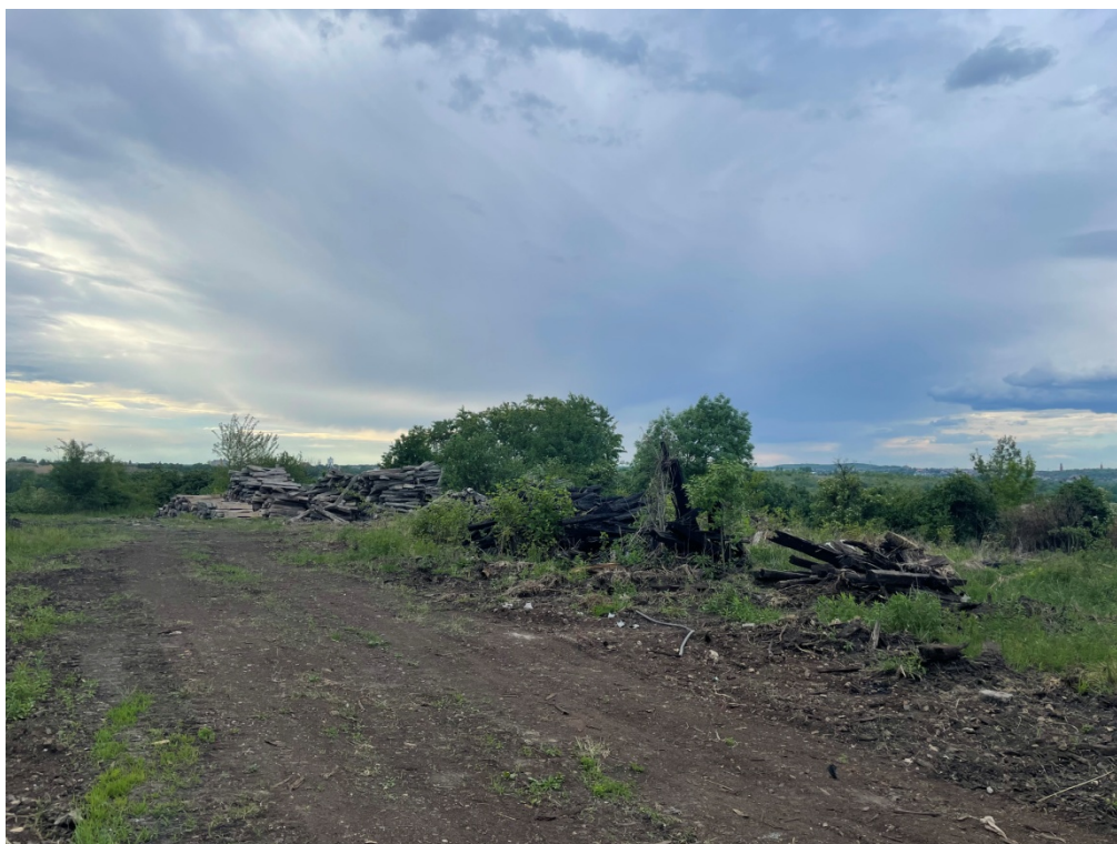
ZDJĘCIE 6 Rejon obszaru pogórniczego nr 136