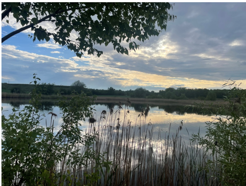
ZDJĘCIE 4 Zbiornik wodny, położony w centralnej części terenu