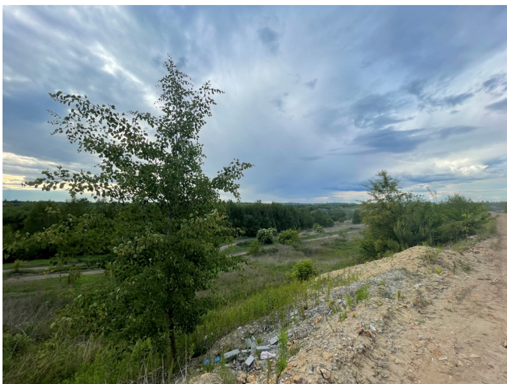
ZDJĘCIE 7 Widok na tor motorowy – wschodnia część terenu