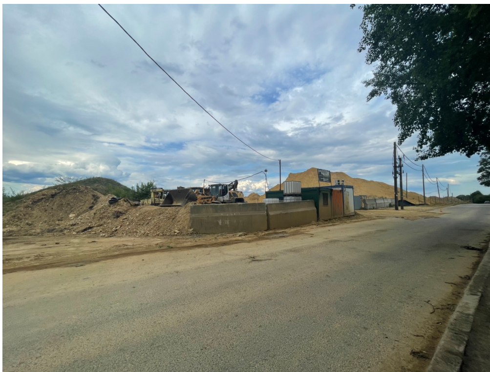
ZDJĘCIE 1 Odkrywkowy Zakład Górniczy Rozbark VI