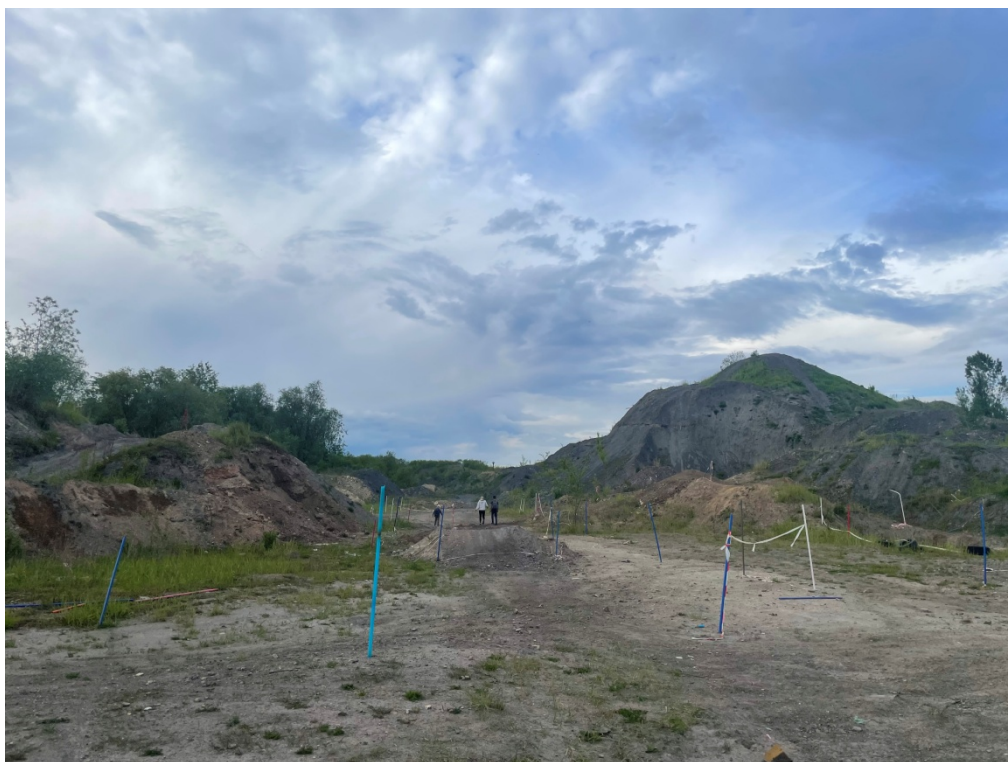
ZDJĘCIE 8 Grunty nasypowe, w rejonie obszaru pogórniczego nr 146