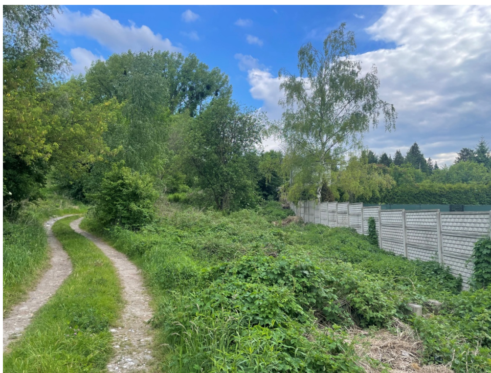
ZDJĘCIE 3 Przykład roślinności spontanicznej – ruderalnej, w południowej części terenu