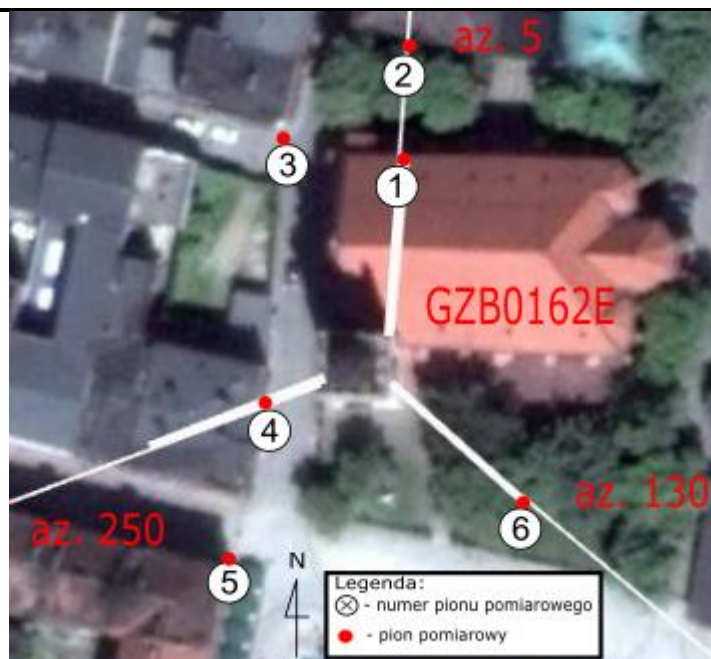
Zdjęcie satelitarne: Image © 2021 Google