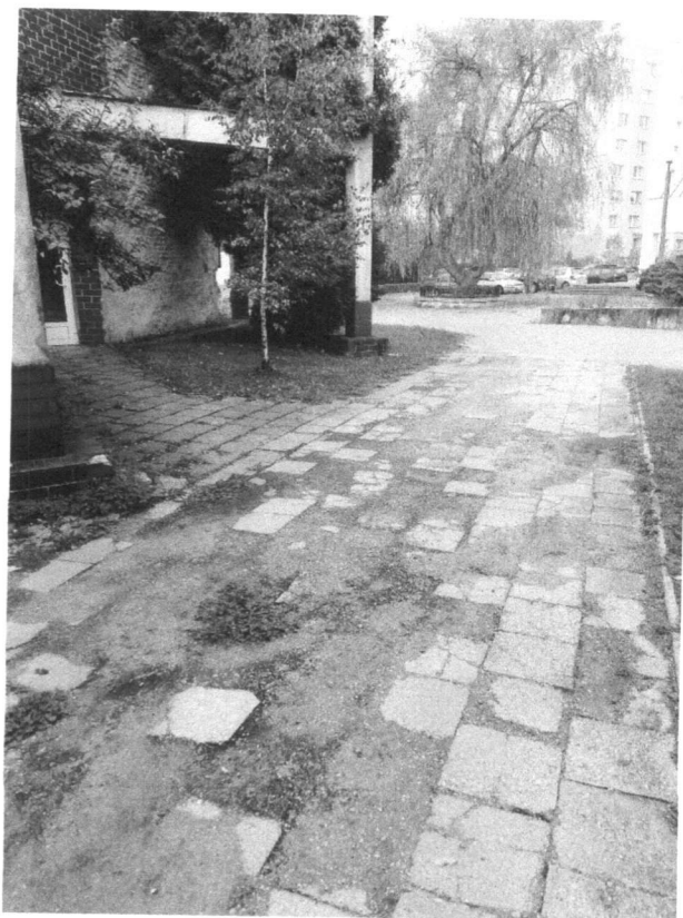
Załącznik nr 4 (główne wejście do budynku przychodni i laboratorium)