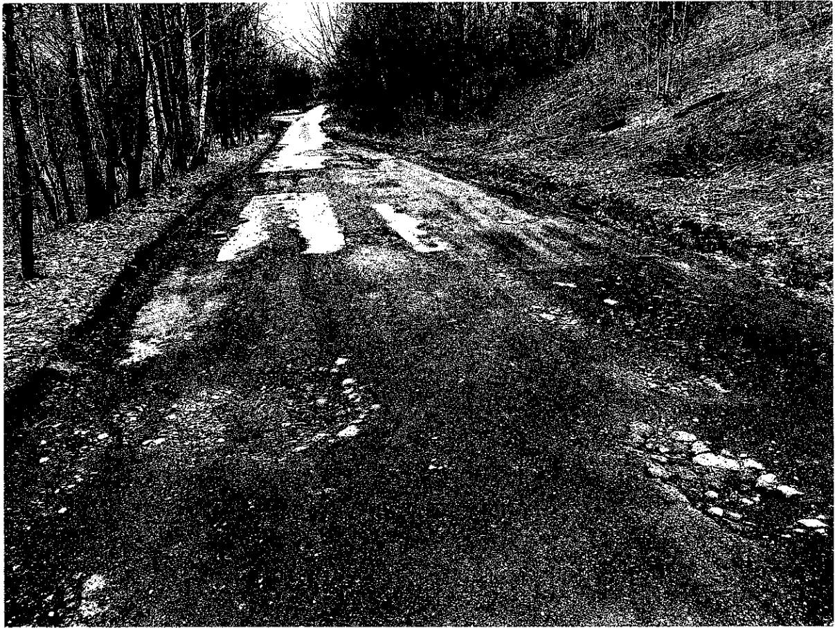
Przykładowe zdjęcie stanu nawierzchni ulicy Kamieńskiej